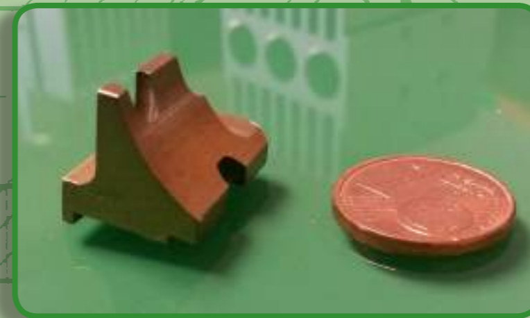
Einer unser kleinster Frästeil / One of our smallest Milled Part

High precision Mechanics and Micromechanics