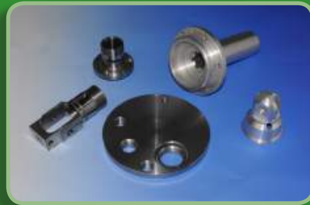
Drehteile / Turned Parts

Ausführung spezieller, auch hochkomplexer Sonderanfertigungen mit Hilfe von CNC-Maschinen auf höchstem technologischen Niveau