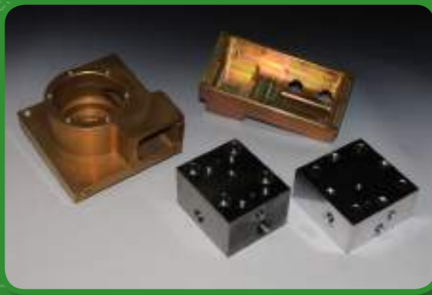
Frästeile / Milled Parts

Carrying out of special and high complex projects using high technologically CNC-Maschines